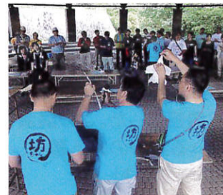
昨年の「井戸端屋台」 (おやしもはまる紙飛行機)

「集まれ～ 愛媛のおやし!」を合言葉に、今年(平成25年)も「第7回愛媛のおやし井戸端会議」が、西条市の「石鎚ふれあいの里」で、6月1日(土)に開催されます。県内はもちろん、県外からも元気なおやし(女性もOK)が参加します。また、今年は子どもの参加も募集します。日頃の活動の報告や自慢、PTAや地域との関わりでの発表。活動メニューの「井戸端屋台」では、親子で一緒に楽しめる遊びを披露。夜は、会議の名物となった「おやしのサバイバル自炊」。準備された食材とレシピで、自分たちで作ります。おもしろいです!一緒に「おやしのネットワーク」を広げませんか?