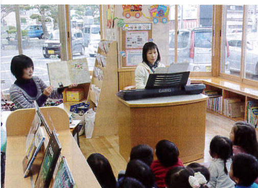
エレクトーンを使った読み聞かせ